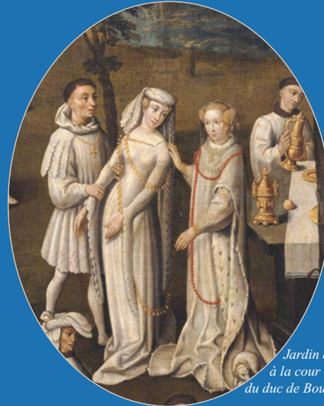
Jardin d'amour à la cour du duc de Bourgogne

HALL DU CENTRE MALESHERBES-SORBONNE vendredi 31 mai et samedi 1 er juin 2013 10H00 - 20H00