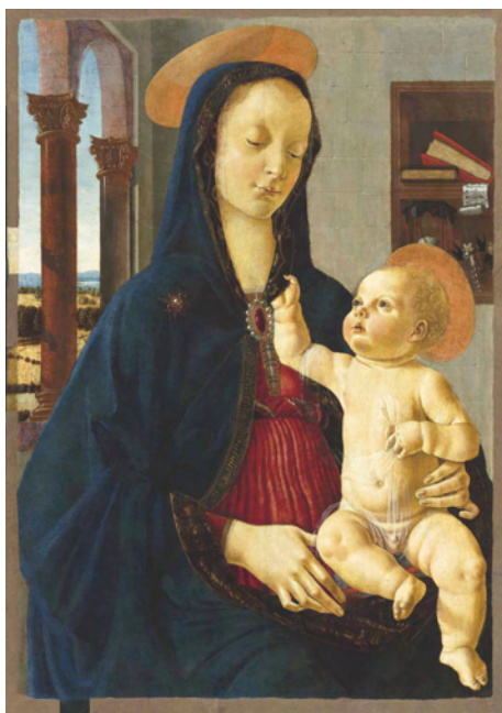
La Vierge et l'Enfant Ghirlandaio Domenico