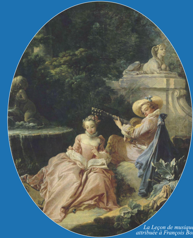
La Leçon de musique, attribuée à François Boucher

VENDREDI 31 MAI ET SAMEDI 1 ER JUIN 2013 10H00 - 20H00 Centre Malesherbes - Sorbonne